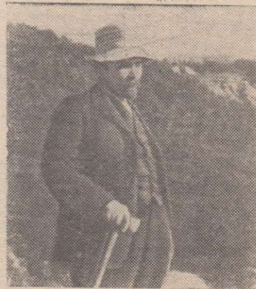
В. И. Ленин на прогулке в горах, в окрестностях Закопане. 1914 год.

Ленин выступил на совещании с большим докладом по национальному вопросу, который в то время приобрел животрепещущее значение.